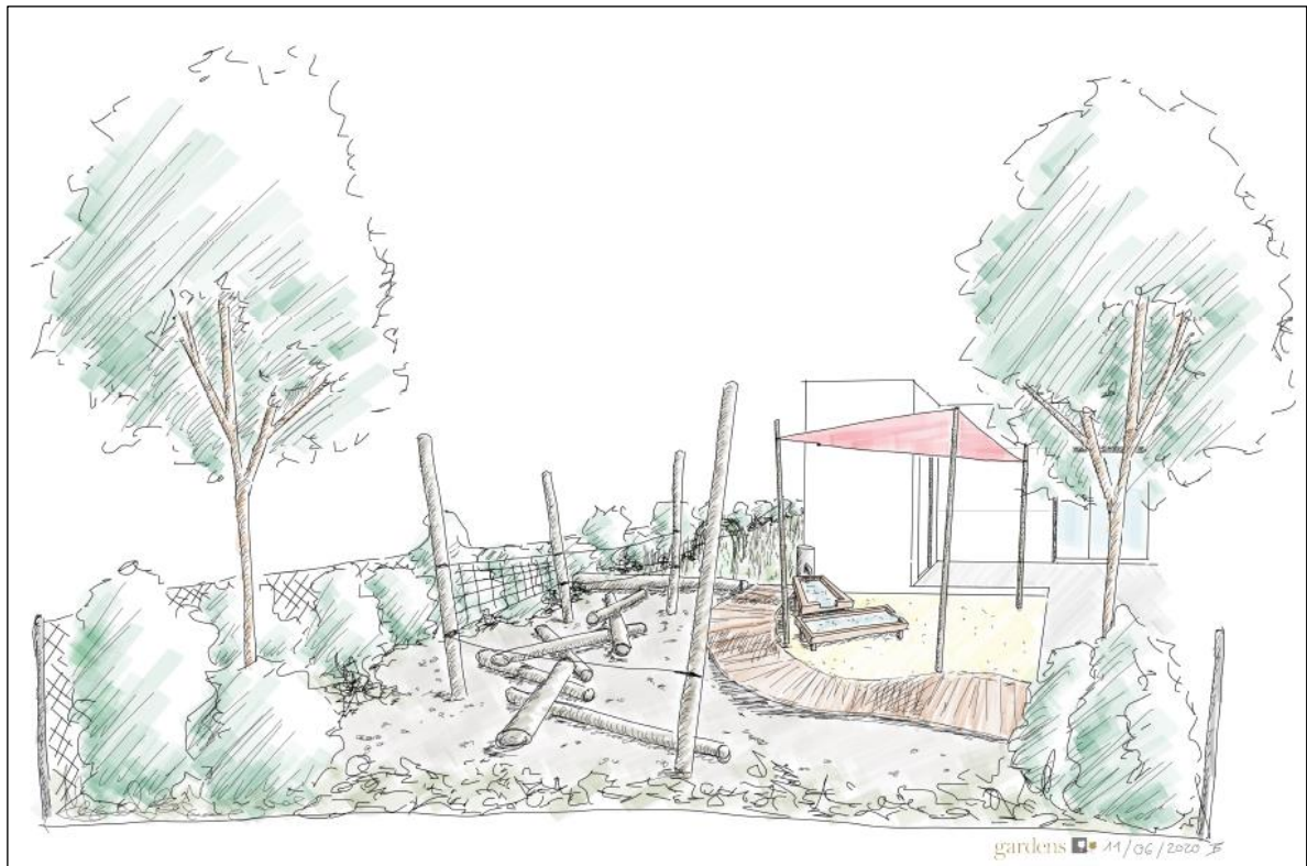
Abbildung 3: Spiellandschaft, Skizze, gardens – Gartenideen AG

Der eingeschossige Holzmodulbau wird nach den energetischen Standards erstellt. Der Doppelkindergarten benötigt zusätzlich für die Wärmeerzeugung eine neue Heizung und eine Anpassung bei der Wärmeverteilung. Der gesamte Kindergarten wird behindertengerecht geplant und verfügt über einen schwellenlosen Zugang.